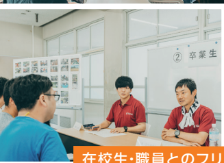
在校生・職員とのフリートーク