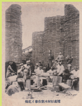
樽底杉材木割仕事と乾燥

はっきりとした姿形を持たず掴み難いけれど、確かにそこにある。この土地に身を置いた作業を通して、奈良ならではの「時間」と向き合っていきたいと思っています。