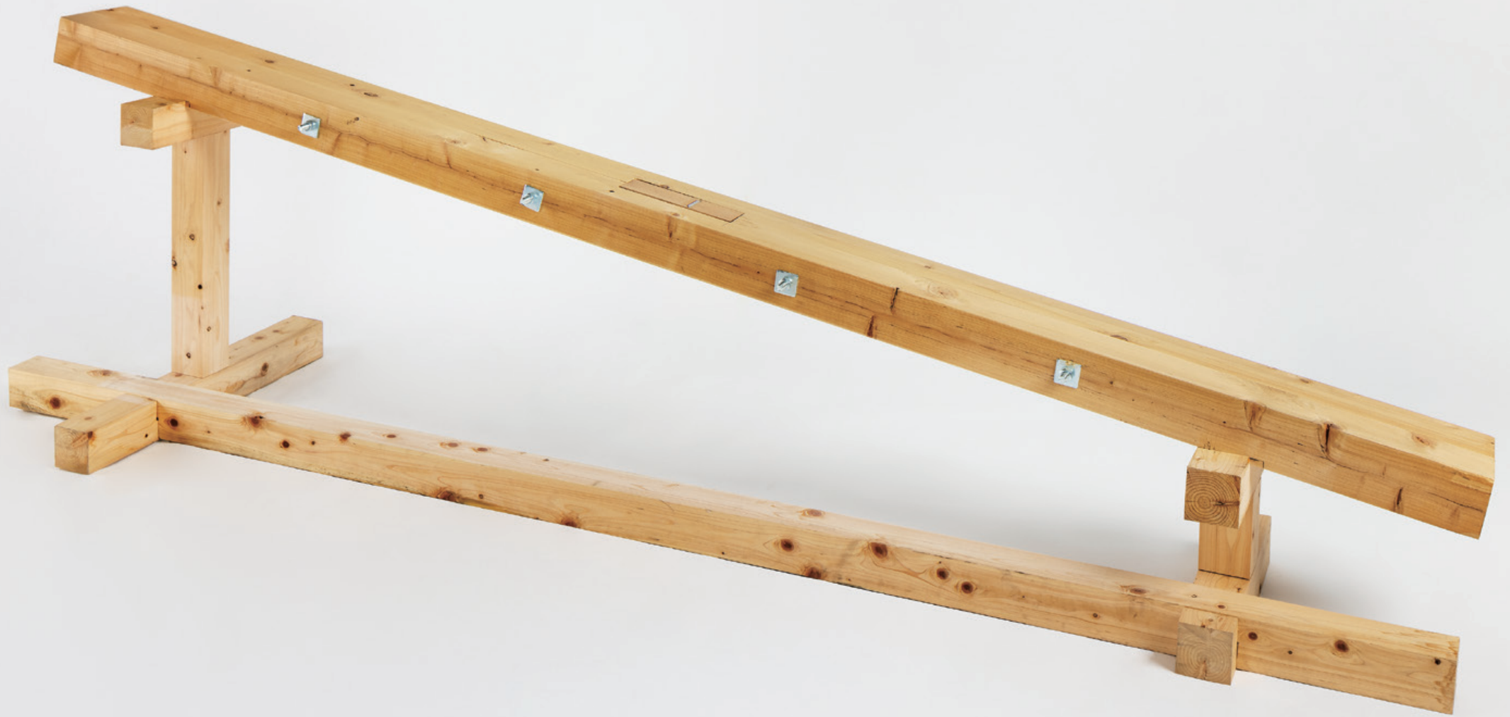
《正直台》 2025 桧、ボルト、座金、ナット h 883 × w 3000 × d 802 (mm)