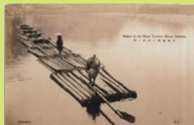
大和吉野川雨中の筏

6月:タルのリサーチで訪れた吉野・匠の祭で見た、かつての樽づくりの様子が分かる写真。