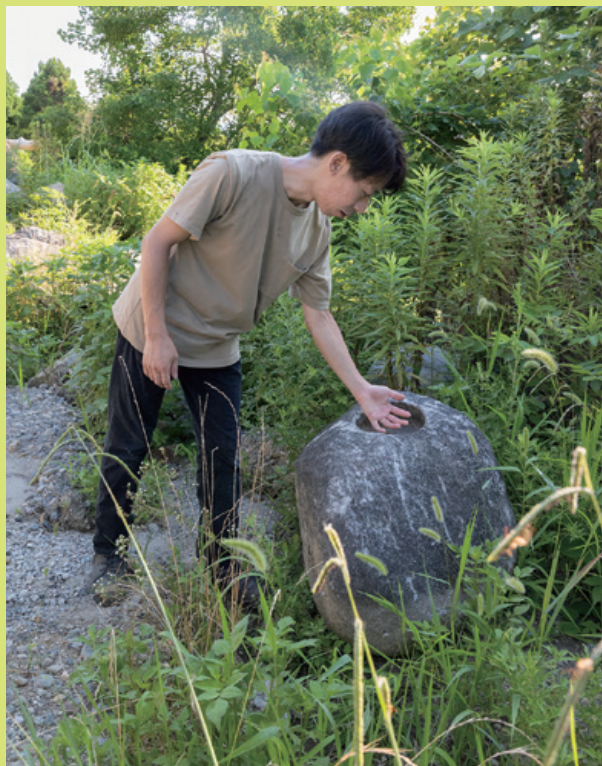
7月:イワのリサーチで訪れた生駒・株式会社山長での素材探しの様子。