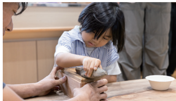
参加者それぞれが鉄筋を火造りで鍛造したもの。研いで仕上げると硬い鯉節もなんとなく削れます。