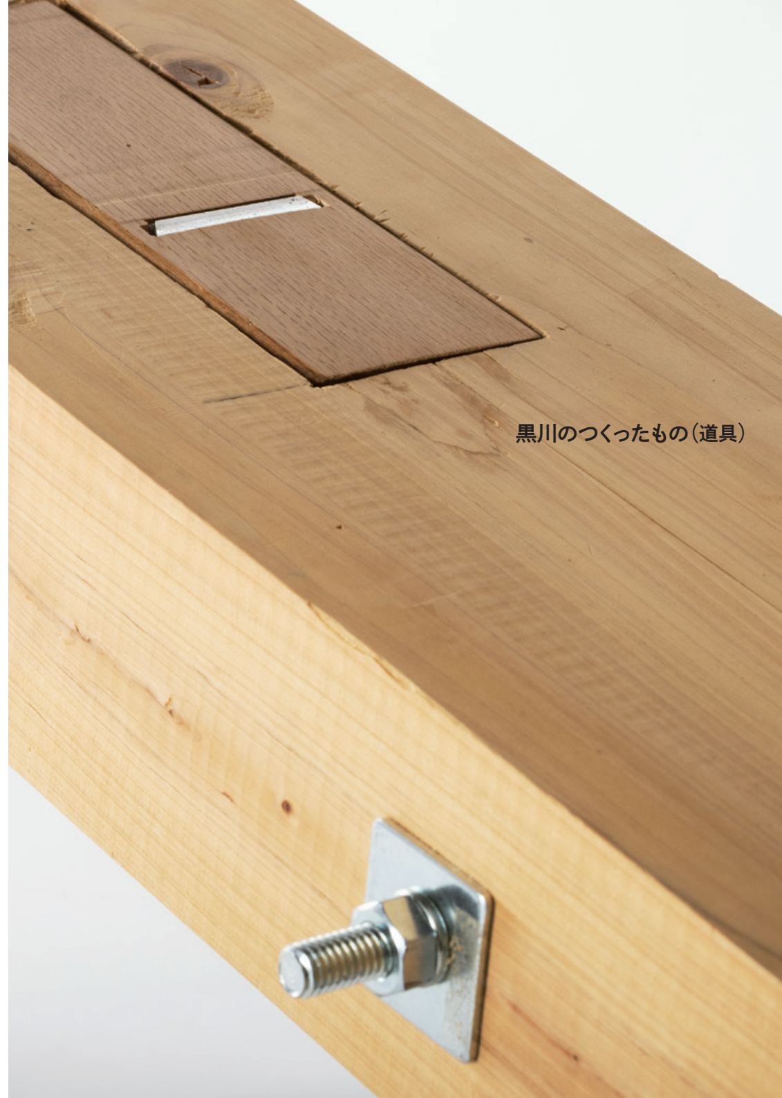
黒川がつくったもの(道具)