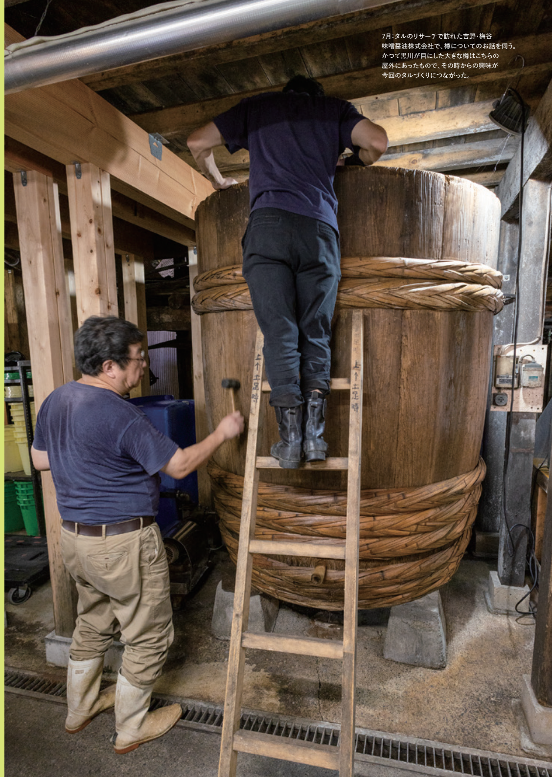
7月:タルのリサーチで訪れた吉野・梅谷味噌醤油株式会社で、樽についてのお話を伺う。かつて黒川が目にした大きな樽はこちらの屋外にあったもので、その時からの興味が今回のタルづくりにつながった。