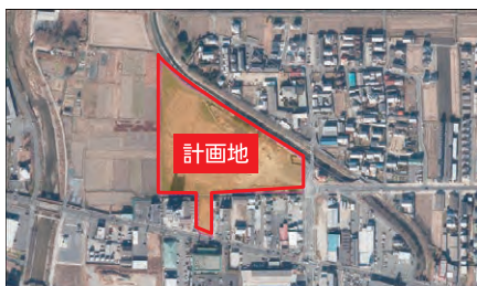
国土地理院地図より作成