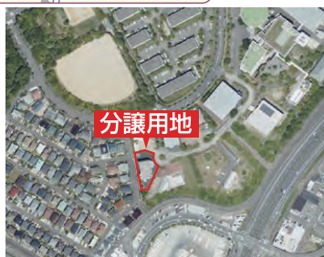
国土地理院地図より作成