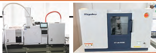
左：熱分解ガスクロマトグラフ質量分析計 令和7年度設置 右：X線CT装置 令和6年度設置