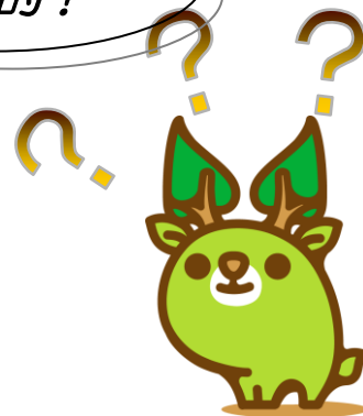
奈良県エコキャラクター 「な～らちゃん」