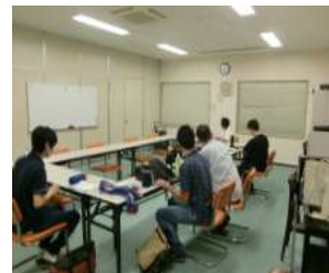
居場所風景:ゲームを楽しむ