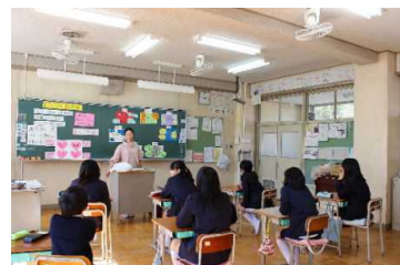
高学年「はははしらべ」