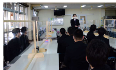
入寮オリエンテーション

数年前までは喫煙や窃盗などの非行に走る生徒もおり、社会規範を理解させることに時間を割くことも多かった。近年は非行に走る生徒はほとんどいなくなったが、高校入学までに不登校を経験している生徒が増加傾向にあり、昼夜が逆転した生活を送っていたり望ましい食生活を送っていなかったりするなど、基本的な生活習慣が確立できていない生徒もいる。そのような生徒は寮生活を送っている生徒に多く、「起床時間に起きて遅刻しないで登校する」、「寮で提供される食事は残さず食べる」といった、本来家庭が担うべき指導も行っている。