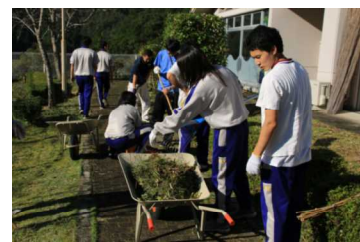
高齢者施設清掃活動

また、学校に誇りを持ち、TPOに応じた態度を取ることができるよう、儀式的行事を実施する際はその意義を生徒に理解させてから式典に臨むよう意識付けをしている。