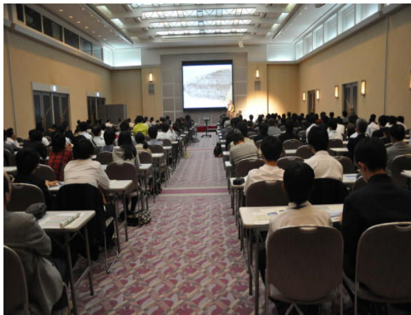
サイエンスフェスティバルの様子

生徒の課題研究に関しては、研究内容をより深化させ、一定の成果を上げつつ、研究の成果は校内や県内では積極的に発表している。しかし、全国的なレベルでの発表や各種オリンピックの予選への応募は増加しつつも、国際的なレベルに挑戦できるものはまだまだ少ない。このことは改善すべき課題である。さらには、本校教員のアンケート結果では、まだ学校全体で取り組めていないとの指摘もある。以上のような課題に対しては、更に全教職員の連携に力を入れて取り組むことを目標としつつ、県内の連携校とともに長期的な奈良県の理数系人材の育成も視野に入れて、科学コンテストやものづくりコンテスト、科学フォーラムを継続的に実施していくことを検討している。