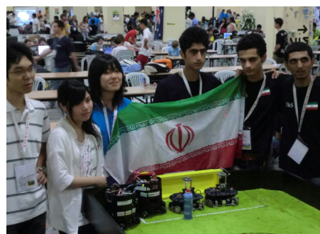
ロボカップ世界大会

ロボット研究会ではWRO、SRC、ロボカップの世界大会を目標に部員とともに取り組み、平成21年度より全国大会に出場、さらには、平成23年度ロボカップ世界大会（イスタンブール大会）では第4位に入賞することができた。また、物理部では物理チャレンジ、パソコン甲子園、缶サット甲子園にも挑戦しており、全国大会への進出の実績を生かして、その活動をより推進している。