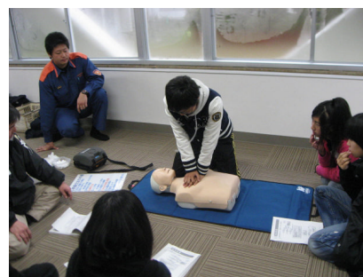
写真：宿泊訓練中のAED研修の様子

「助けられる人から助ける人へ」を直接実行する活動として、生徒たちは真剣に取り組んだ。人命救助を行う上で、恥ずかしさや照れは妨げとなり、命の危機に直面した際、「とにかく勇気をもって、精一杯取り組むこと」の大切さを救命救急士から教えられた。