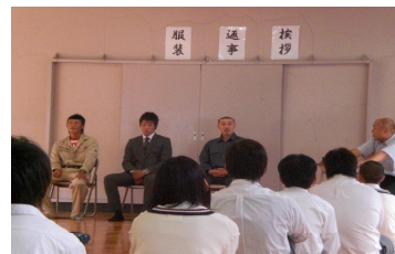
生徒の規範意識を高める集会

本校では、生徒自身が被害者にも加害者にもならない危機回避能力を身に付ける機会として、「生徒の規範意識を高める集会」を年4回実施している。本集会では、警察(サポートセンターを含む)や保健所、助産師、電話会社、薬剤師会等をはじめ、本校卒業生を講師とした講演会等を行うとともに、奈良県高等学校生徒指導研究協議会発行の「ホームルーム活動テキストわれら人間創造」を活用した、「人としての在り方・生き方」教育を展開し、成果も上がっている。また、教職員の研修会も積極的に実施し、その取組が知識だけに留まらず、実践力や対応力、応用力等の向上にもつながるよう、その内容の充実に努めている。