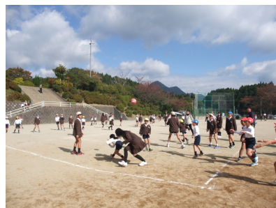
（全校外遊びの様子）