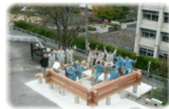
「課題研究」ログハウス製作風景

「分かる授業の展開」では、振り返り授業や基礎講座の充実はもちろん、専門高校としての特性を生かした実習にも力を入れており、この取組が、生徒の学ぶ意欲の喚起や自信につながり、自ら展望をもって行動できる生徒も増えた。「進路指導の充実」では、計画的に「自らの力で進路実現を図る」取組を展開し、その結果、資格取得や各種競技会・コンテスト等に積極的に参加する生徒が増え、進路決定率も大幅に向上した。このように、一人一人に夢や希望・目標をもたせる取組は、生徒が自分自身を変える力の源となることを実感する取組となった。