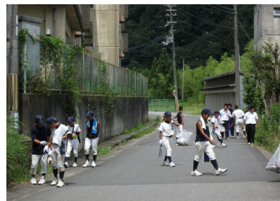
生徒会清掃奉仕活動

さらに、取り巻きの生徒を変容させるために、「自己決定の場を与えること」、「自己存在感を与えること」、「共感的人間関係を育成すること」という生徒指導の3つの機能を全教員が心に留めて実践に当たった。勤労生産・奉仕的活動を通しての「自己決定から自己存在感」を生徒に体得させる取組。「校内川柳コンクール」への応募活動を通して自己存在感と共感的人間関係の育成に向けた学級での取組。さらには、全校朝会での部活動報告や学校行事の感想発表などの言語活動を取り入れた生徒の主体的活動機会を設け、自己存在感と共感的人間関係の育成に向けた全校での取組。このような取組を通して少しずつではあるが教員集団がそれぞれの分掌の中で、積極的な生徒指導を実践に移している。これにより、生徒の規範意識が徐々にではあるが、向上するとともに、安心して学校生活を送れることの素晴らしさを生徒自身が実感できつつあるように感じる。