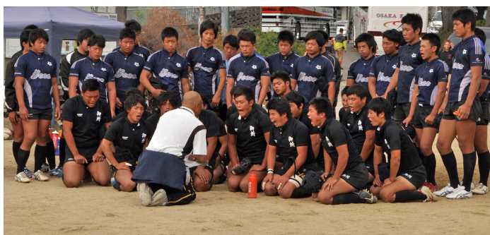
生徒目線を心がける試合後のミーティング

私は、夢とは近付けるものであり、掴むものだと思っている。毎日の練習を持続していれば必ずチャンスが来ると信じている。何故なら、今までのOBたちが多くの経験を通じて積み上げてくれた失敗や成功のマニュアルの上に、今の御所実業高等学校ラグビー部のスタイルができたからである。真剣に勝ちたいという思いを強く持ち続けること。そうすれば必ずチャンスが来ると今も信じている。