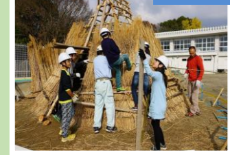
地域と協働して 「縦穴式住居」づくり