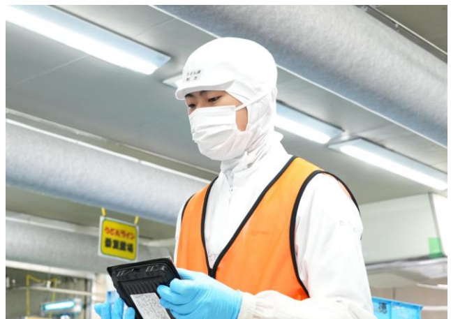
商品の検品（大徳食品株式会社）