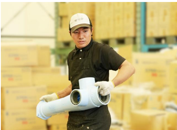
铸件下水道部品整理（株式会社日電鉄工所）