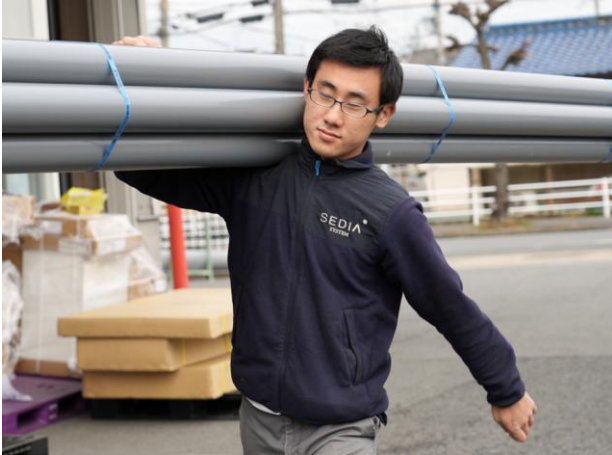
塩ビパイプの搬出（渡辺パイプ株式会社 奈良サービスセンター）

奈良県では、障害のある人が自分の能力を発揮できる仕事に就き、安心して働き続けることができる社会の実現に向けた取組を進めています。奈良県と奈良労働局は、奈良県雇用対策協定を締結し、障害のある人の雇用に積極的な企業等で構成される「障害者はたらく応援団なら」を設立して、障害のある人のニーズに応じた職場実習の受入や就労定着に向けた支援を行っています。