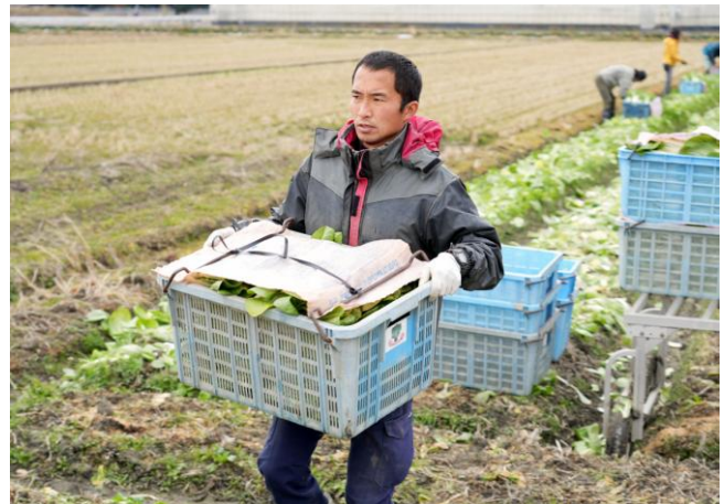
しろ菜の収穫（UEDA なっば工房）