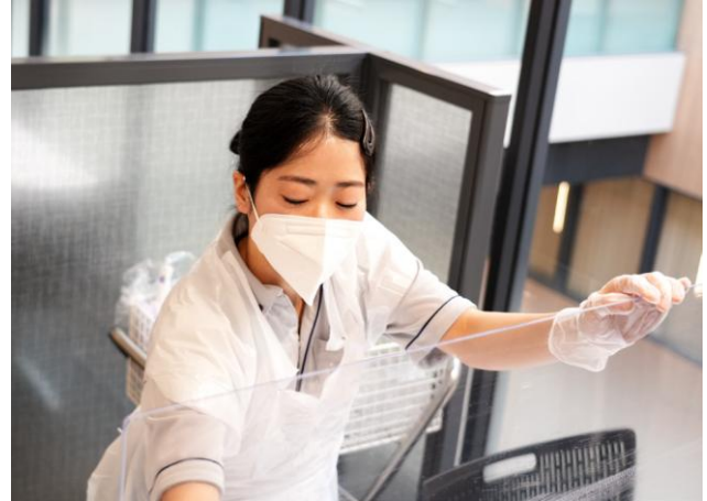
備品の消毒（奈良県総合医療センター）