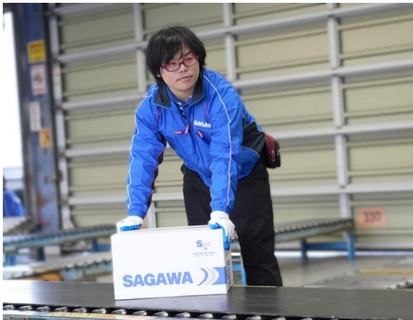
配達品の仕分け（佐川急便株式会社 御所営業所）