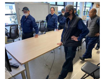
<セミナー時の様子>