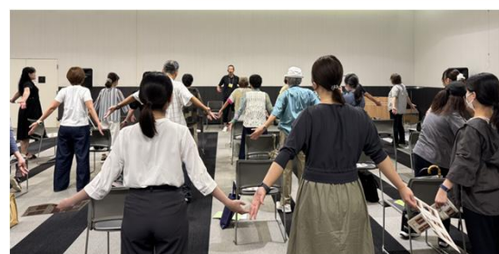
<イベント開催時の様子 @イオンモール大和郡山>