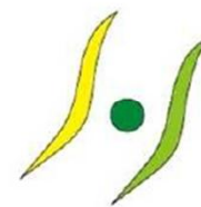
奈良県社員・シャイン 職場づくり推進企業