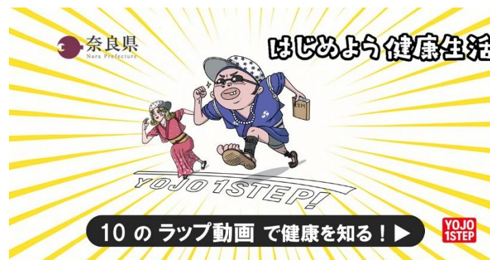
<バナー広告イメージ>