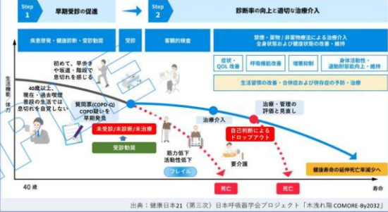
出典:健康日本21 (第三次) 日本呼吸器学会プロジェクト「水洩れ漏 COMORE-By2032」