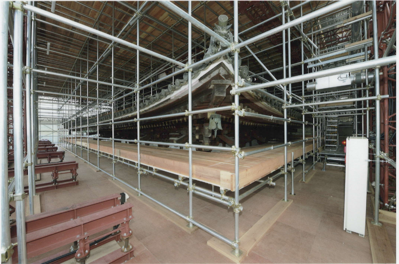
素屋根2階(一重目軒足場)