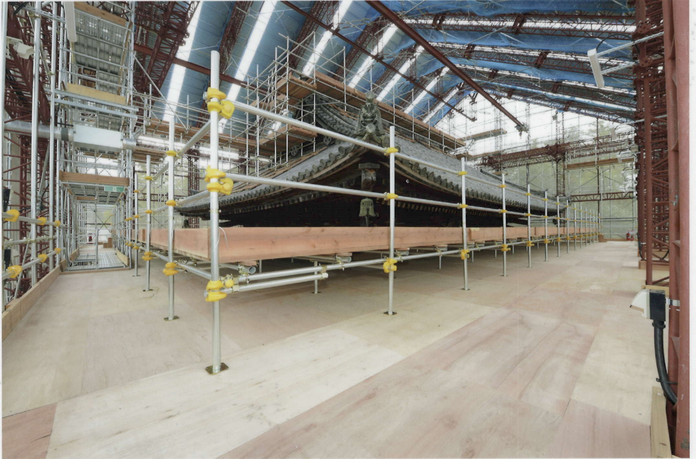
素屋根3階(二重目軒足場)