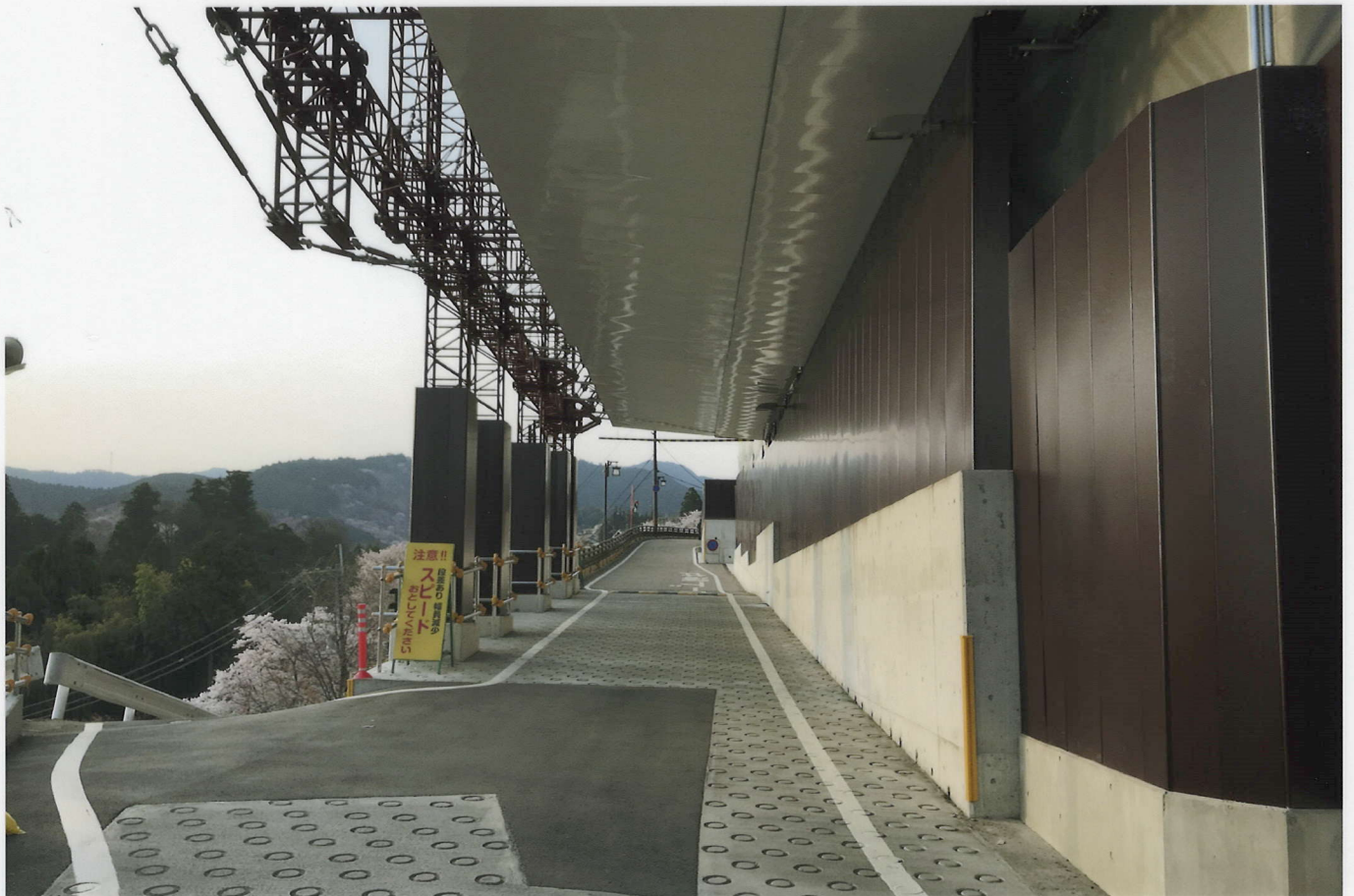
東側道路トンネル部