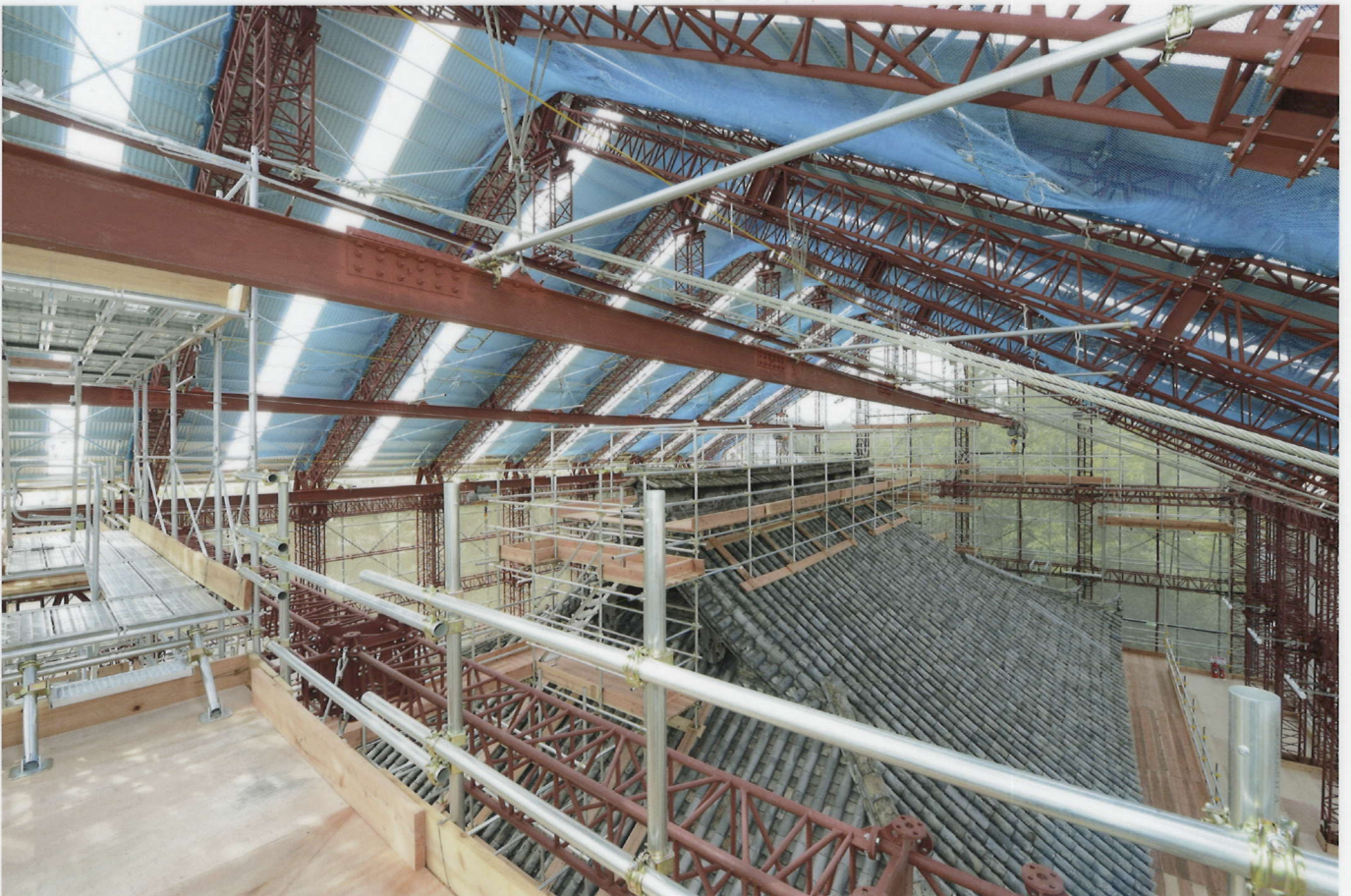
素屋根上階(妻足場・棟足場)