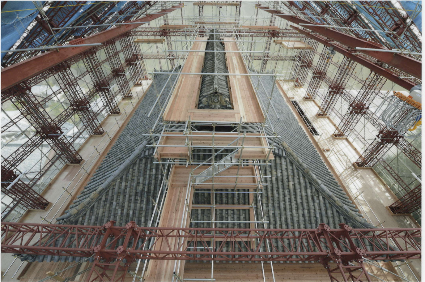
素屋根上階(妻足場・棟足場)