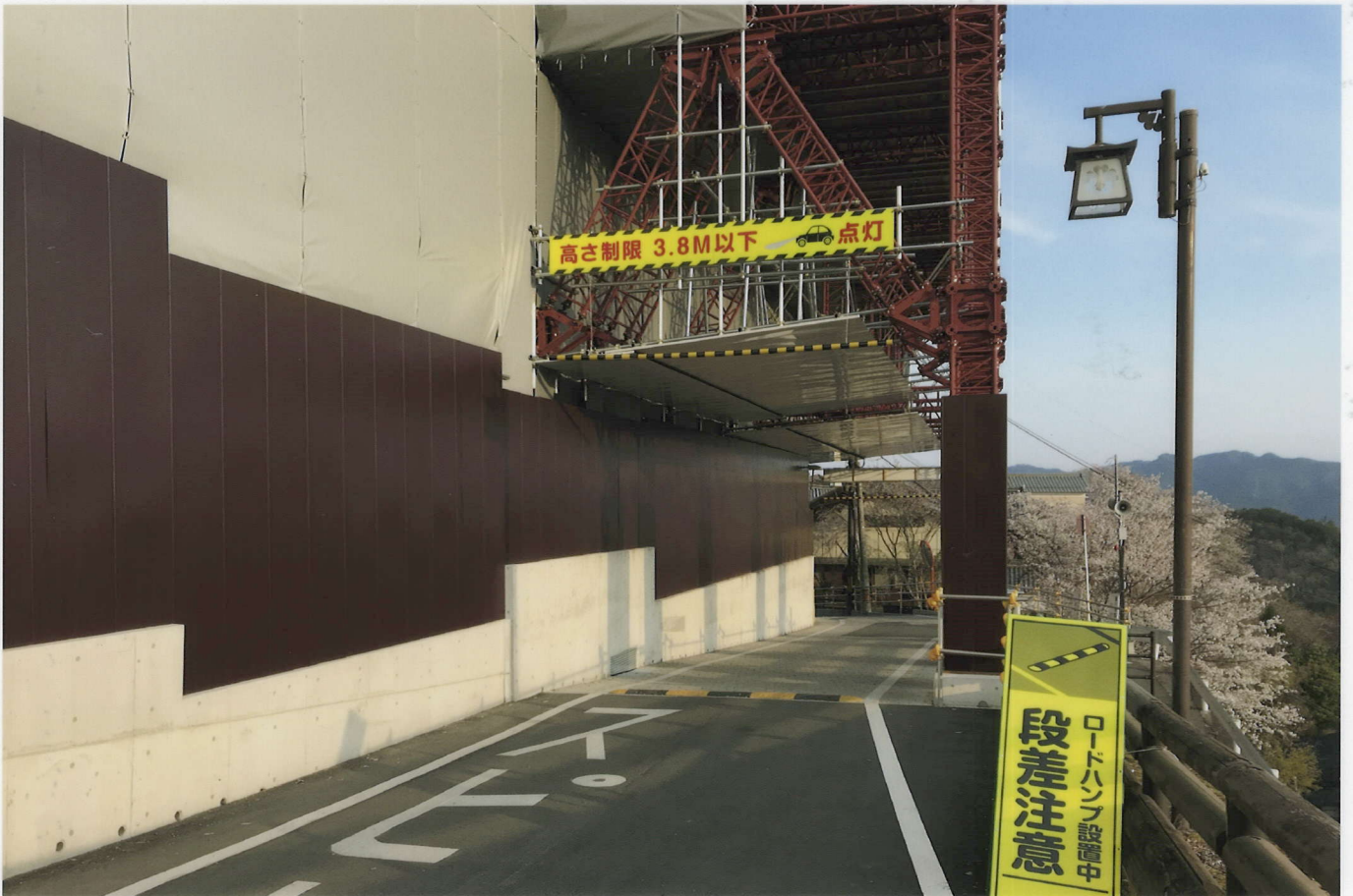
東側道路トンネル部 南口