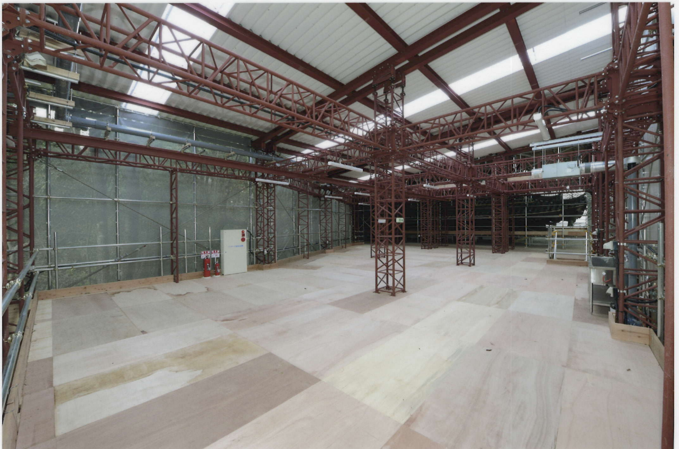
作業場2階(一重目軒足場レベル)