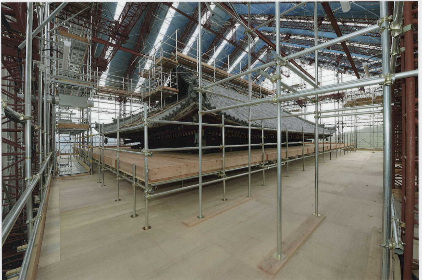
素屋根3階(二重目軒足場)