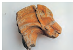
発掘調査で見つかった土馬(頭部)