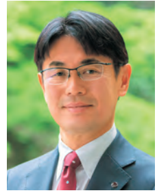
奈良県知事 山下真

会議の立ち上げから3年経ち、様々な成果が出てきました。令和5年度と7年度を比較しますと、新規の長期病休者は69人から48人に減り、働き方に満足している職員の割合は58.4%から67.7%に増え、男性の新規育児休業の取得者は49人から65人に増えました。また、採用試験の改革も行った結果、試験(1種・社会人)の平均的な倍率は3.1倍から5.3倍に増えました。ただ、県庁の職員数は約3,800人で、職場環境の改善が隔々まで及んでいるわけではありません。この取組に終わりはありませんので、粘り強く続けてまいります。