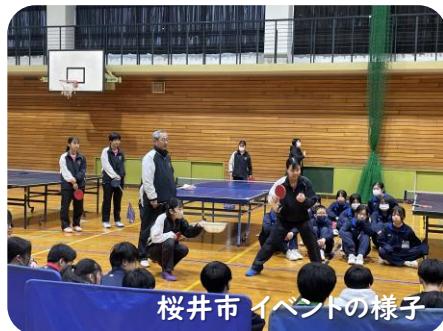
桜井市 イベントの様子