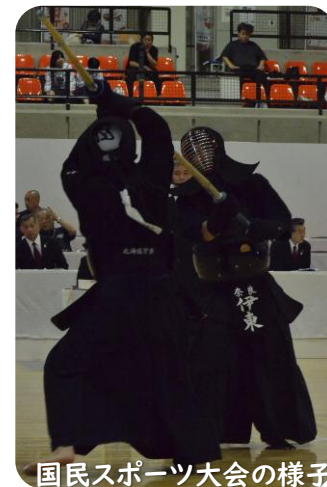
国民スポーツ大会の様子