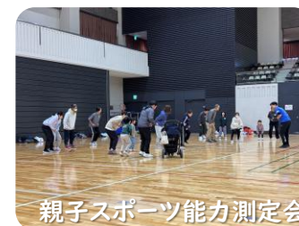
親子スポーツ能力測定会