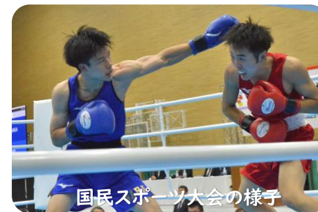
国民スポーツ大会の様子