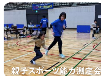
親子スポーツ能力測定会