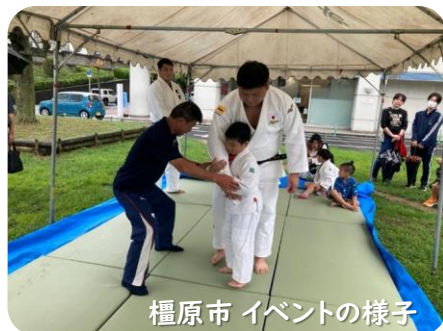
檀原市 イベントの様子