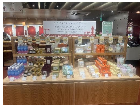
昨年度実施の様子

※奈良まほろば館が設置する選定委員会において、出品申請書及び商品サンプル等を基に、採否を審査します。(審査の結果、不採択になる場合があります。)