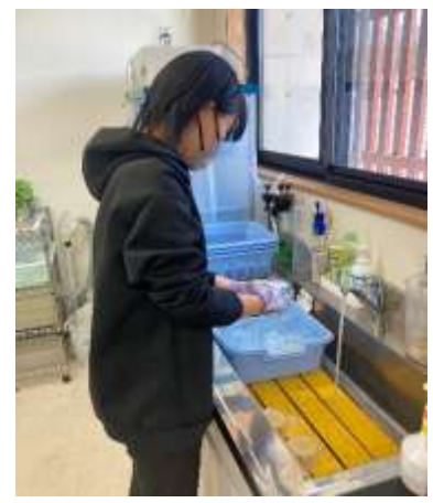
○ガラス器具等の洗浄作業