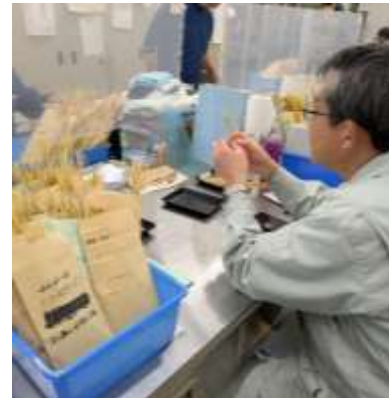
○室内での植物の調査

害虫の飼育や調査、病原菌の培養や病気を調査します。注意しながら正確に作業をします。