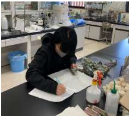
○室内での病害虫の実験・調査

害虫の飼育や調査、病原菌の培養や病気を調査します。注意しながら正確に作業をします。