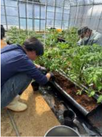
○ビニールハウス内での作業

暑い中での作業では、熱中症に注意が必要です。植物に触れたり、農薬を使用するので、肌がかぶれることもあります。