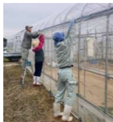
○ビニールハウスの組み立て作業

リーダーの指示を受けて、複数人で作業をします。脚立に乗って作業することもあります。