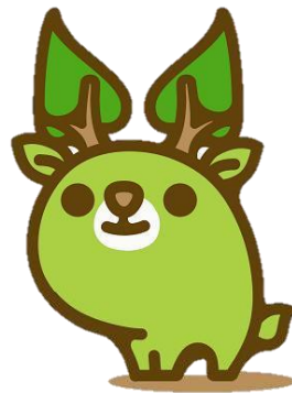
奈良県エコキャラクター な～らちゃん