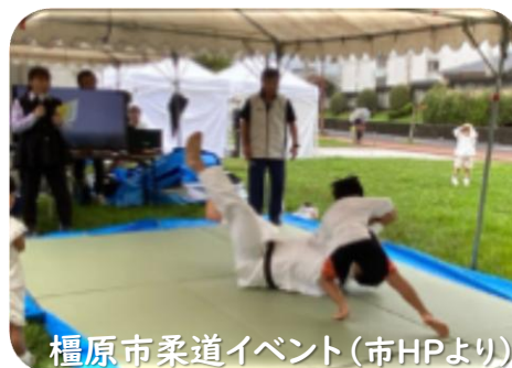
檀原市柔道イベント