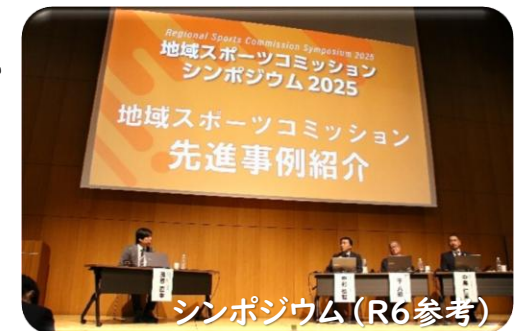
シンポジウム(R6参考)