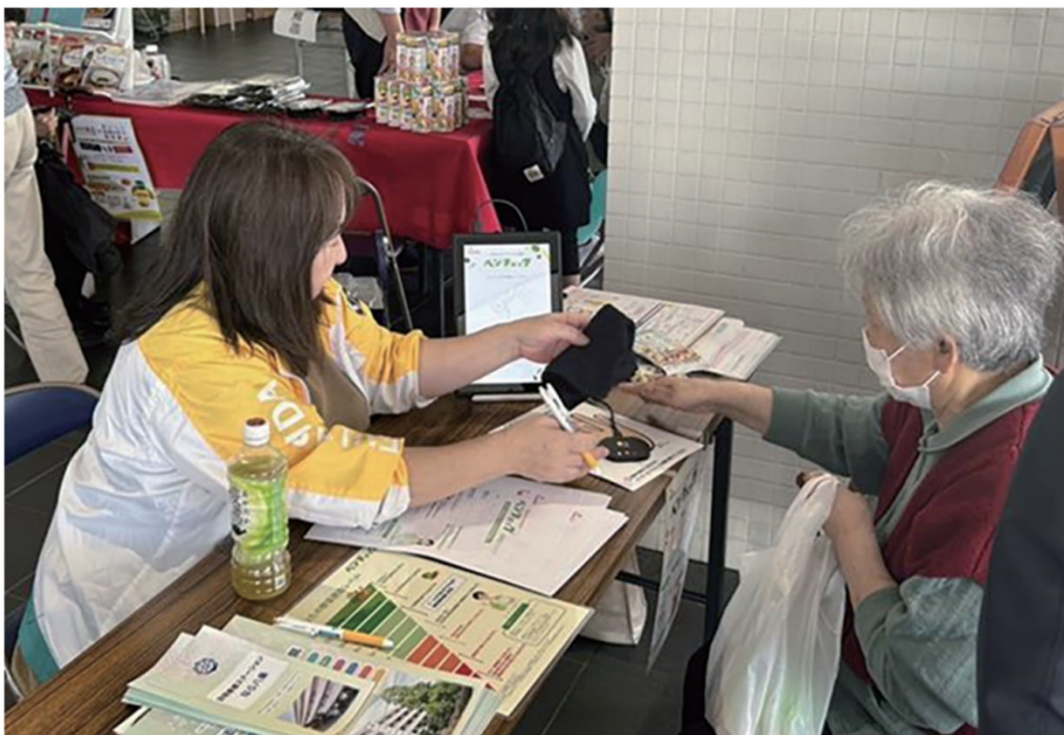
<健康チェックイベントの開催>