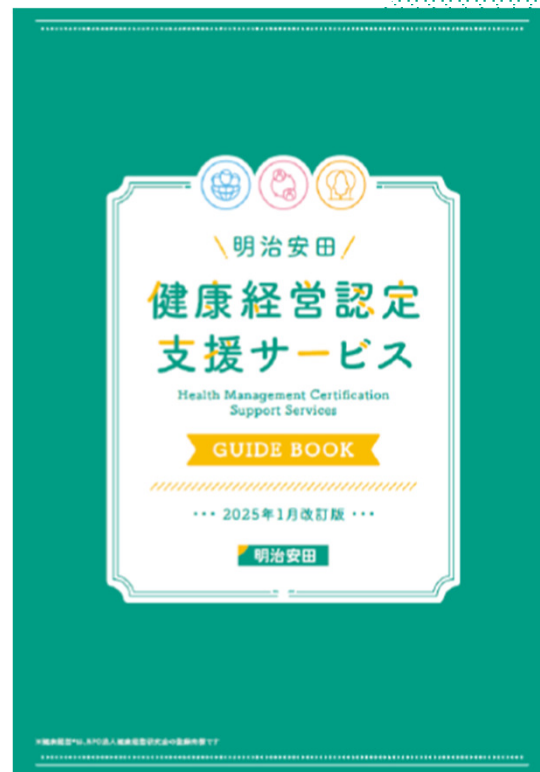
<健康経営優良法人認定の支援サービス>