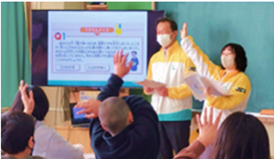
<金融保険授業の開催>