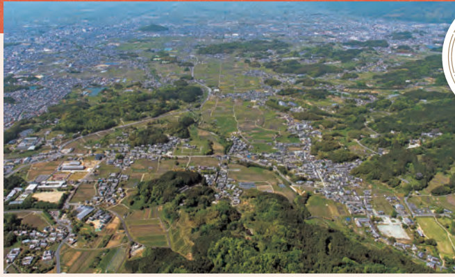
▲南東側には「飛鳥の宮都」があった盆地、北西側には「藤原の宮都」があった平野が広がる (明日香村上空より北を望む)