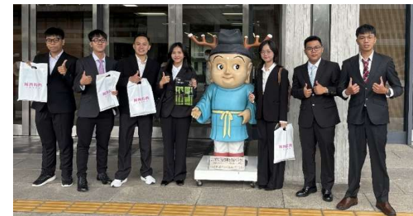
R7.10 ベトナム・ホーチミン市工科大学の学生7名が来日