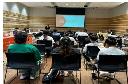
外国人材留学生等と企業の交流会