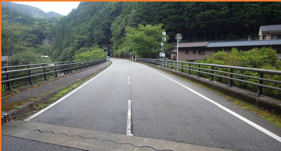
リフレッシュプロジェクト実施前