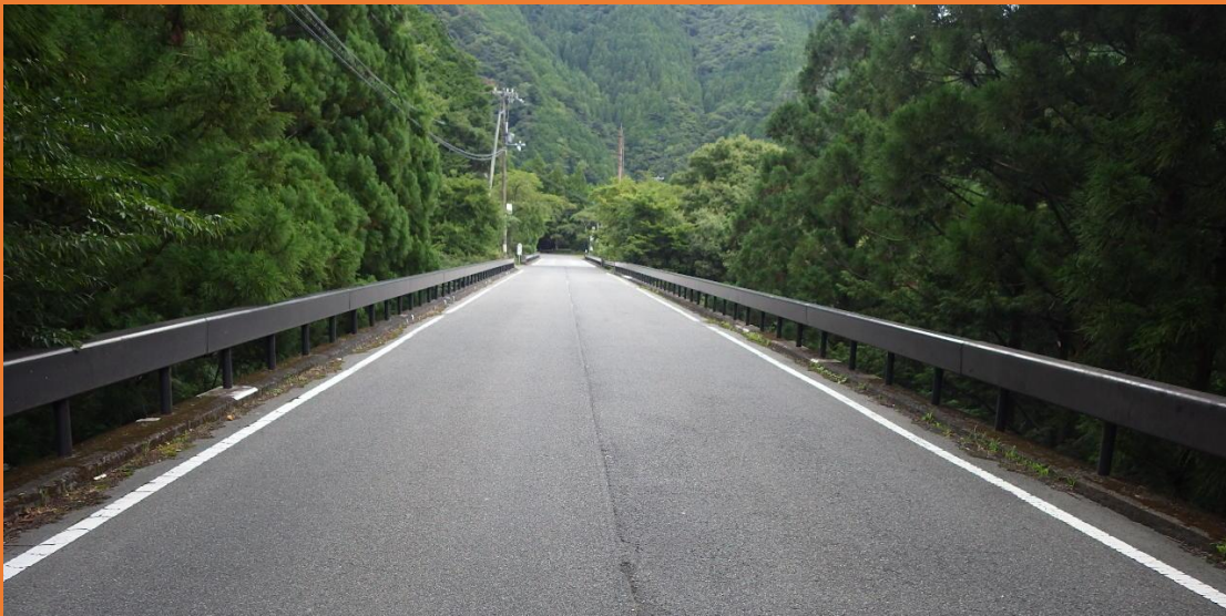
リフレッシュプロジェクト実施前