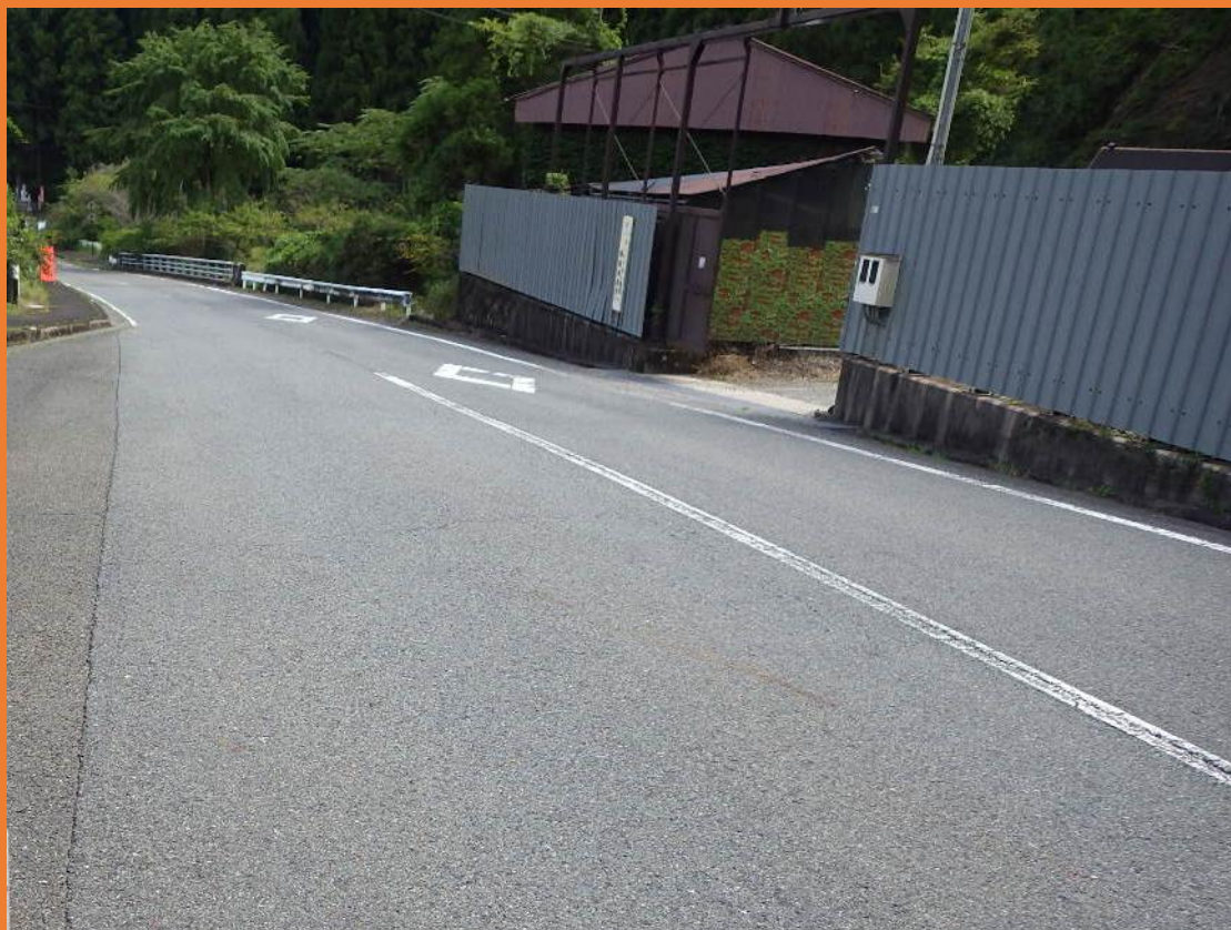
リフレッシュプロジェクト実施前