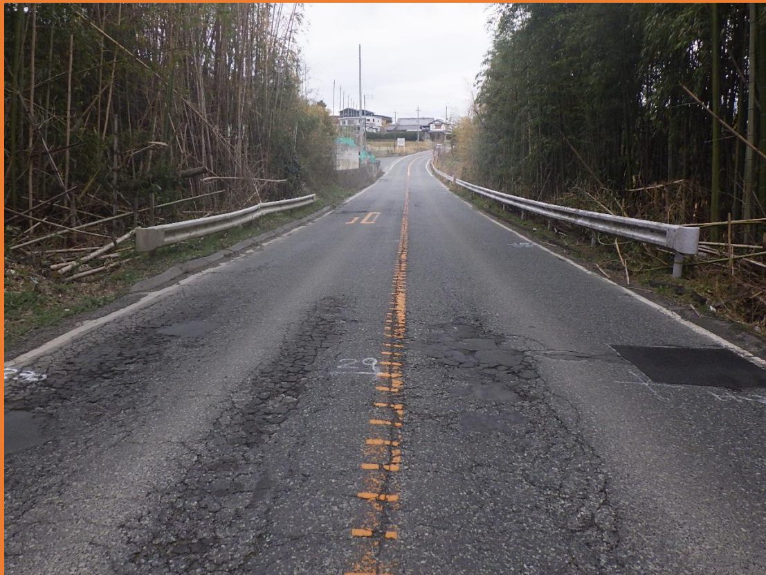
リフレッシュプロジェクト実施前