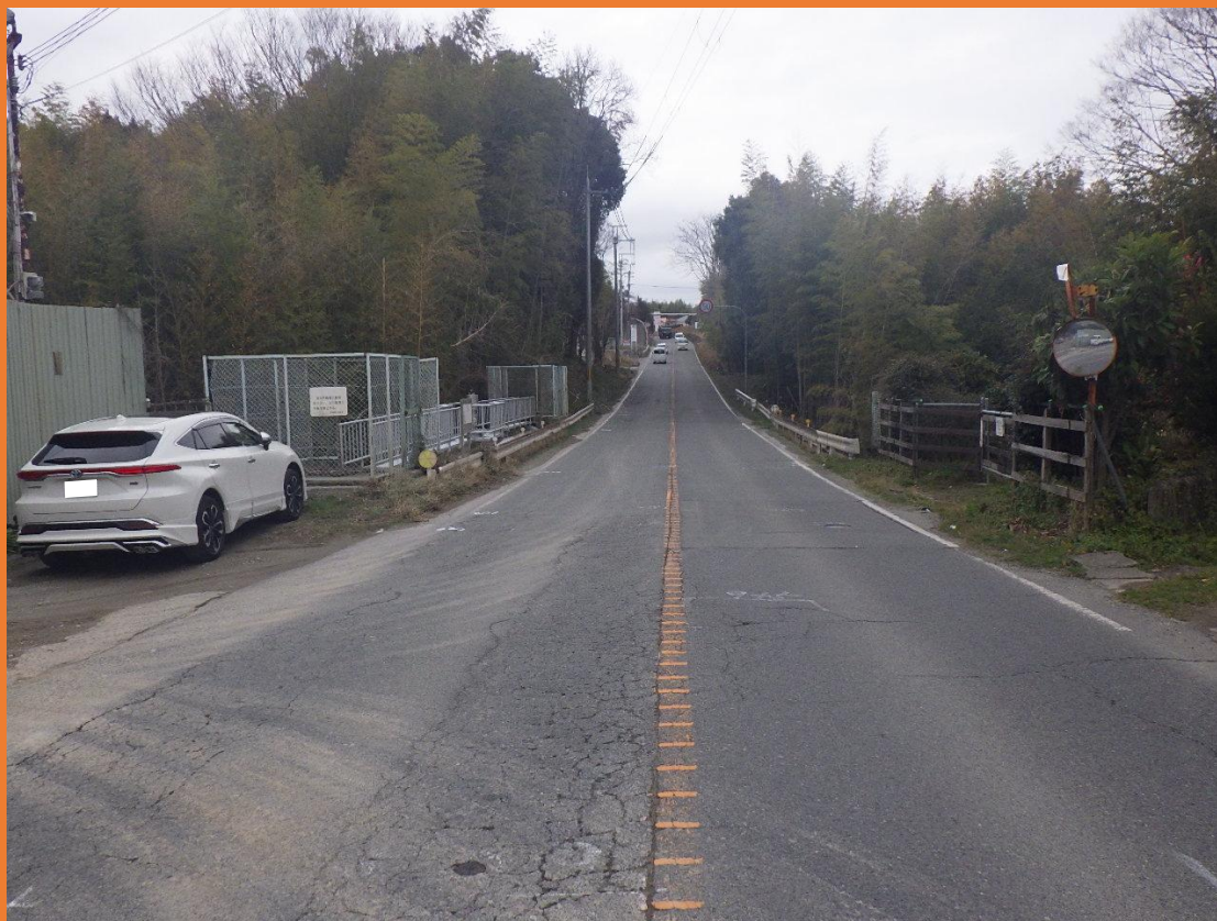
リフレッシュプロジェクト実施前