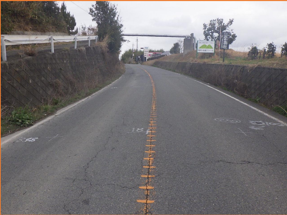
リフレッシュプロジェクト実施前 リフレッシュプロジェクト実施前