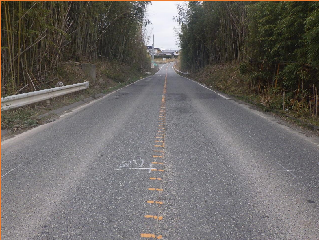
リフレッシュプロジェクト実施前