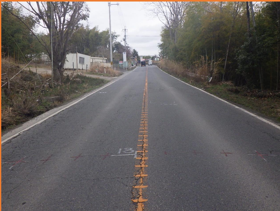
リフレッシュプロジェクト実施前