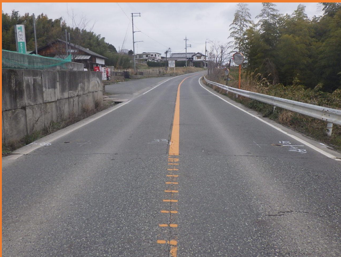
リフレッシュプロジェクト実施前