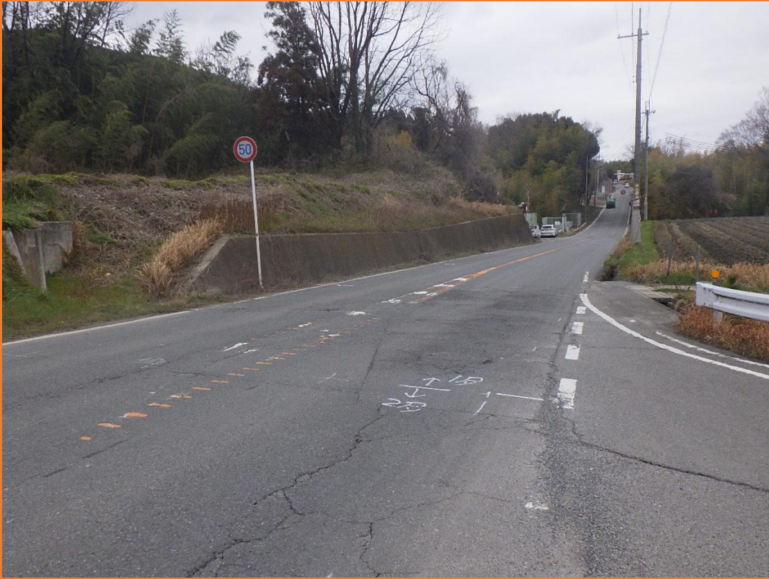
リフレッシュプロジェクト実施前