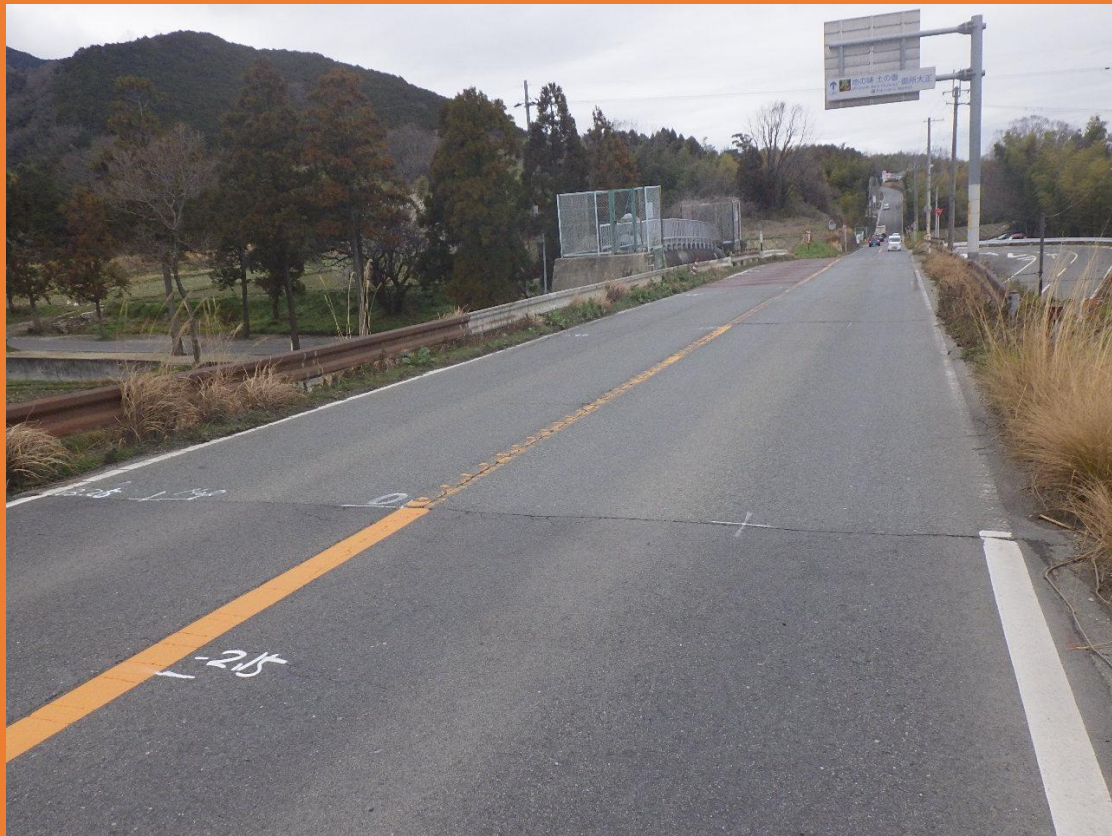
リフレッシュプロジェクト実施前