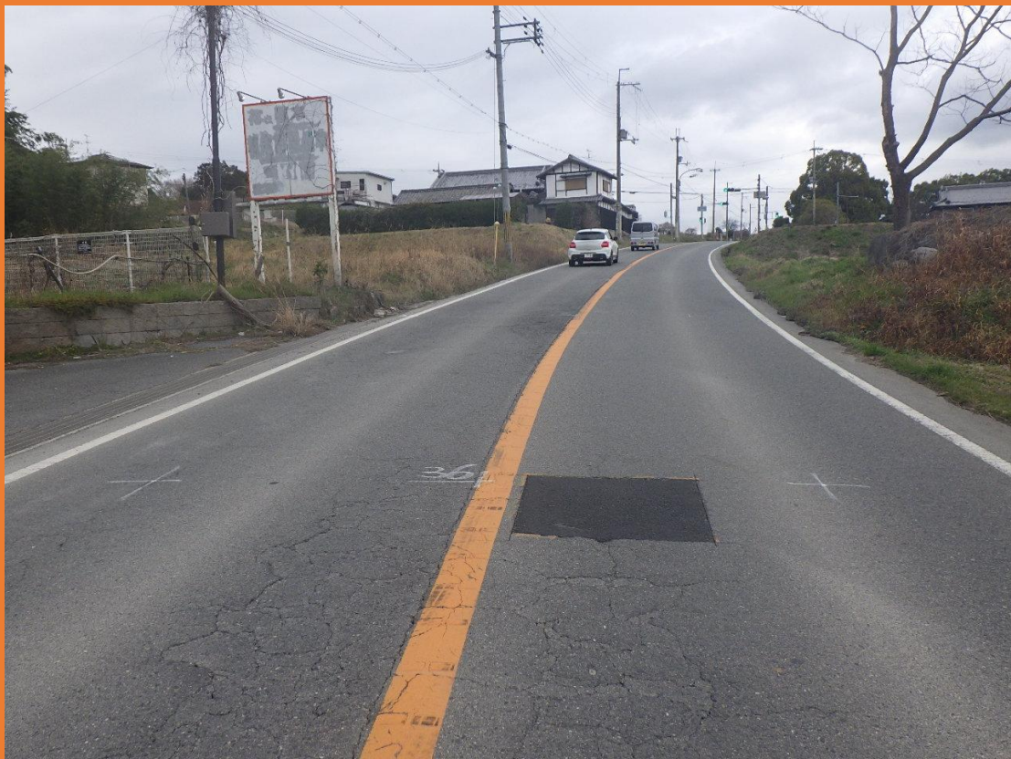
リフレッシュプロジェクト実施前