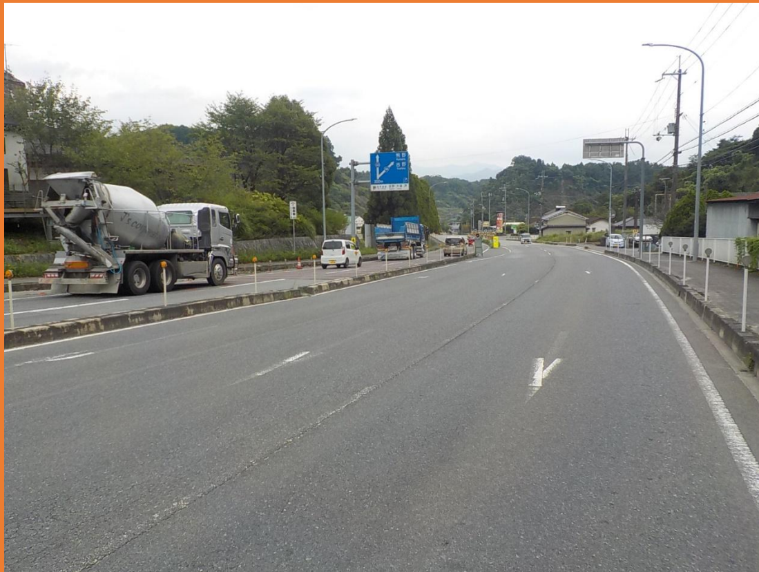
リフレッシュプロジェクト実施前