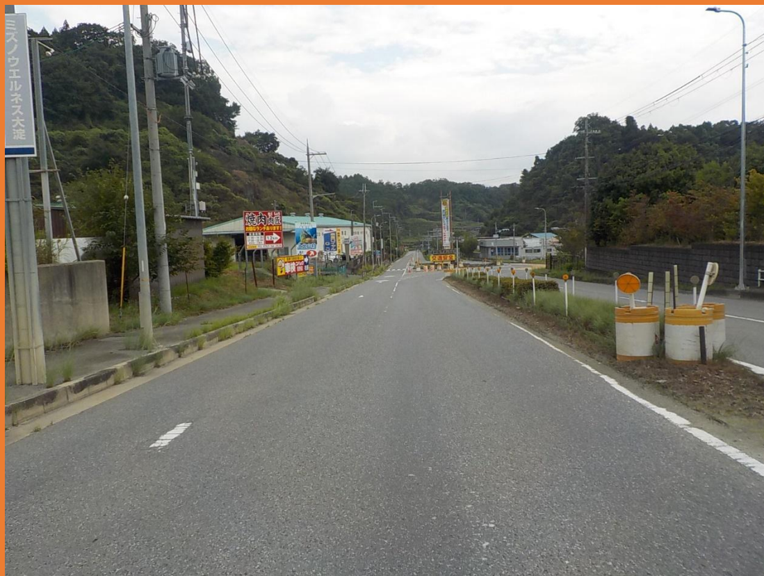
リフレッシュプロジェクト実施前