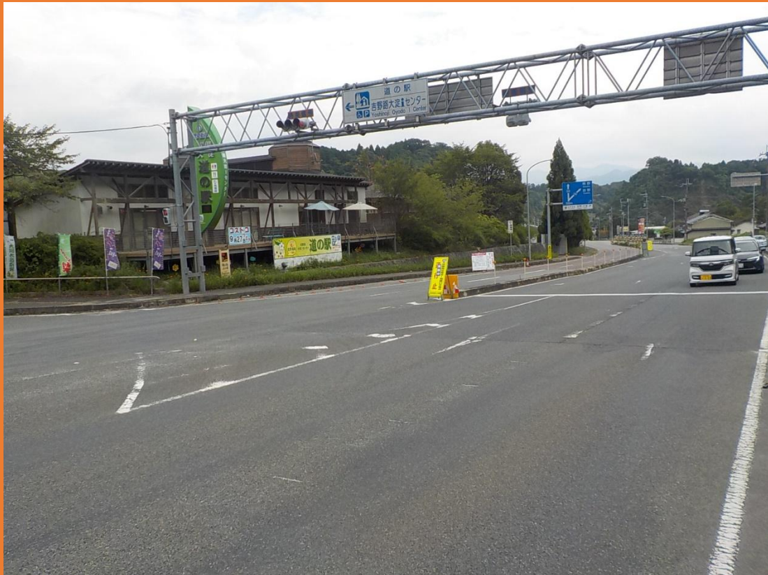
リフレッシュプロジェクト実施前