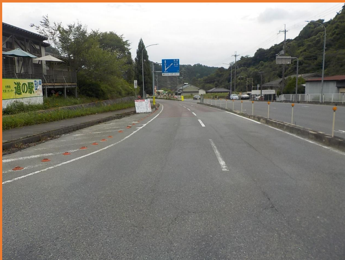
リフレッシュプロジェクト実施前