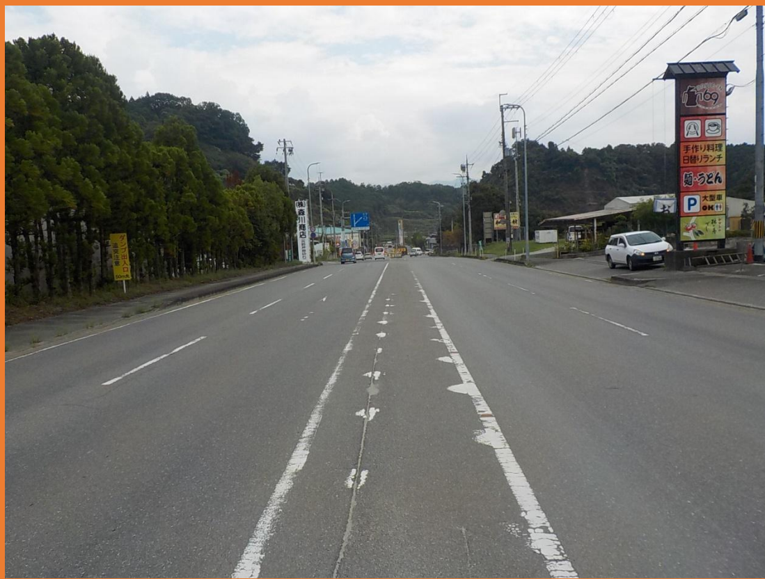
リフレッシュプロジェクト実施前