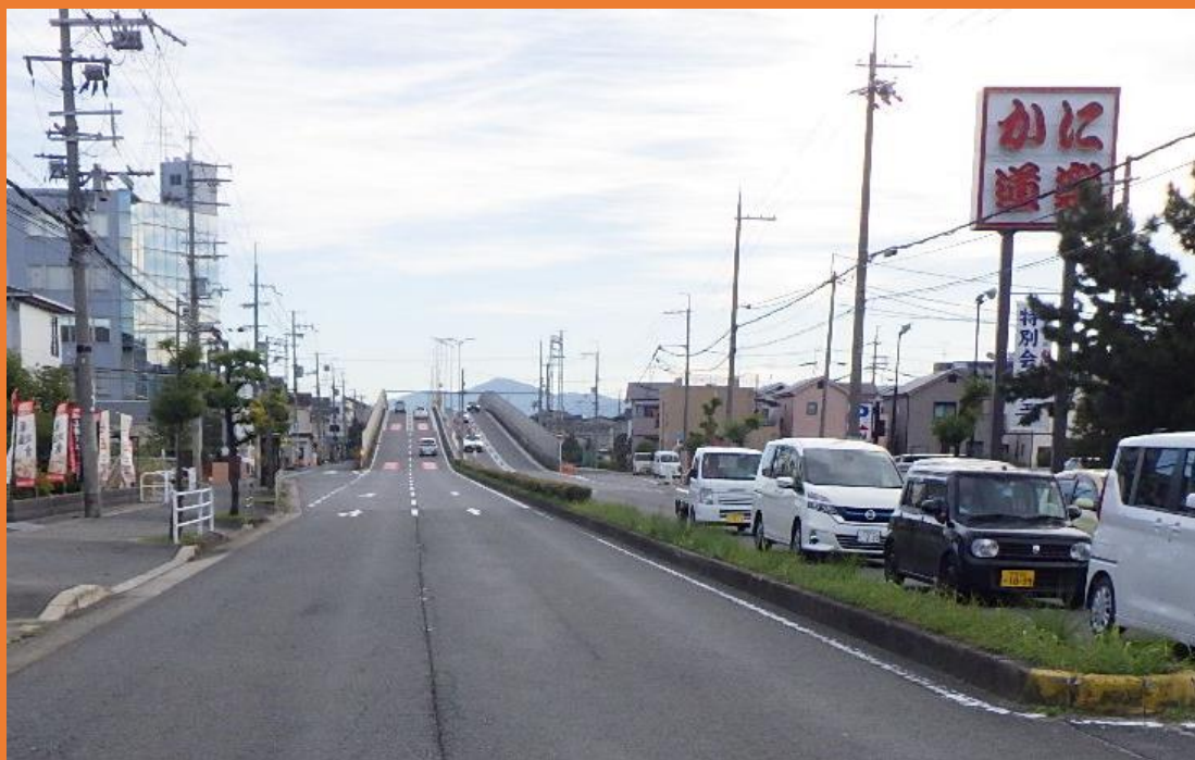
リフレッシュプロジェクト実施前