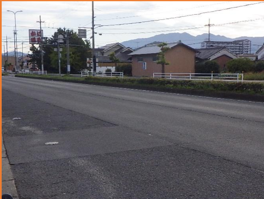
リフレッシュプロジェクト実施前