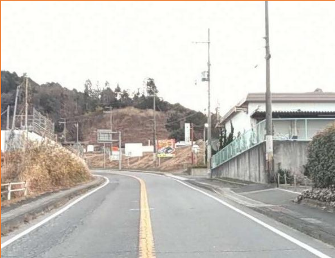
リフレッシュプロジェクト実施前