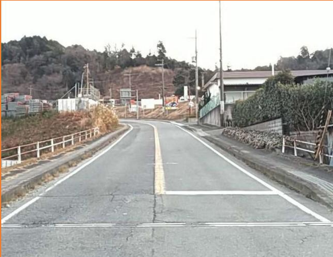
リフレッシュプロジェクト実施前