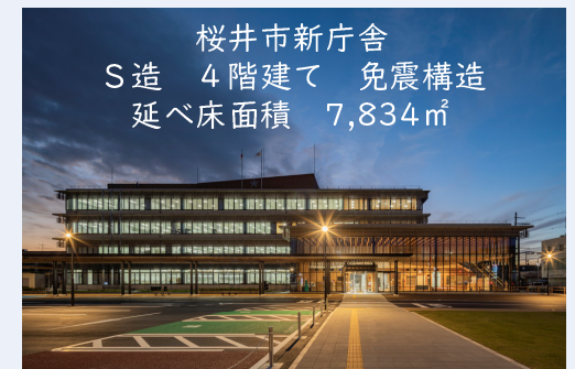
桜井市新庁舎 S造 4階建て 免震構造 延べ床面積 7,834㎡