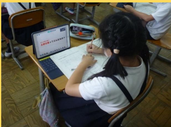
各自のタブレットで講義資料を確認 (R3：平群北小学校)