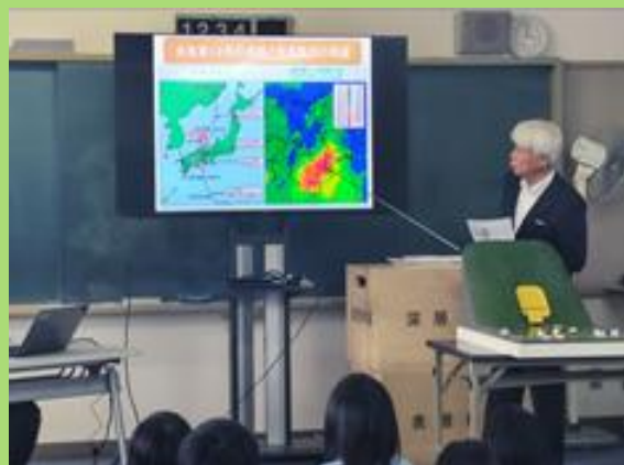
砂防ボランティア協会員による紀伊半島 大水害時の体験談(R7：五條東中学校)