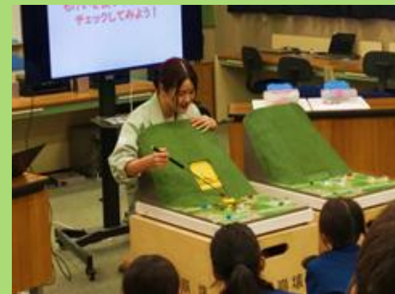
深層崩壊のメカニズムを 模型で解説(R7：桜井南小学校)