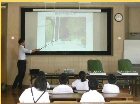
対面授業 (R6：秋津小学校)

○通常の対面方式の他に、令和3年度よりオンラインでの開催にも対応しました。また、児童・生徒のPCやタブレットに資料を映したり、各自で自宅や学校付近の危険箇所を確認したりするなど、IT機器を利用して個々に合わせた学びが行えるよう工夫しています。