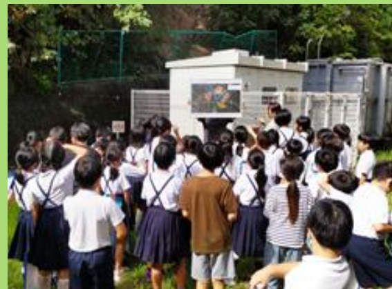
学校付近にある土砂災害警戒区域の 現地確認(R7：五條東小学校)

○座学だけではなく、模型実演や危険箇所の現地確認、VR体験といった様々なプログラムを通して、土砂災害の危険性や身を守る方法などを伝えています。また、奈良県砂防ボランティア協会(県土木職員OB)の方にも紀伊半島大水害時の対応等について講義いただいています。