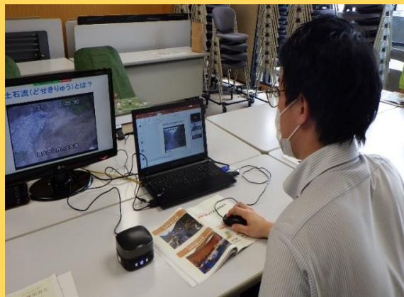
県庁～学校間オンライン (R3：鶴舞小学校)