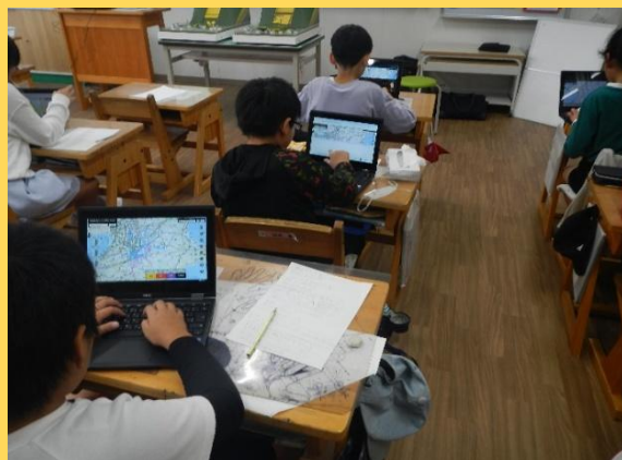
各自のPCで土砂災害警戒区域を確認 (R6：下市あきつ学園)