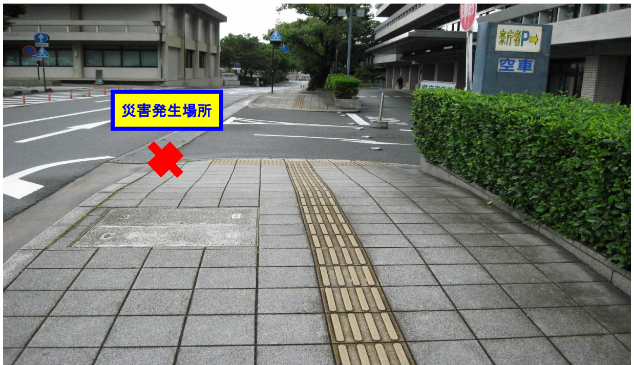
(撮影方向) 東 → 西方向へ撮影