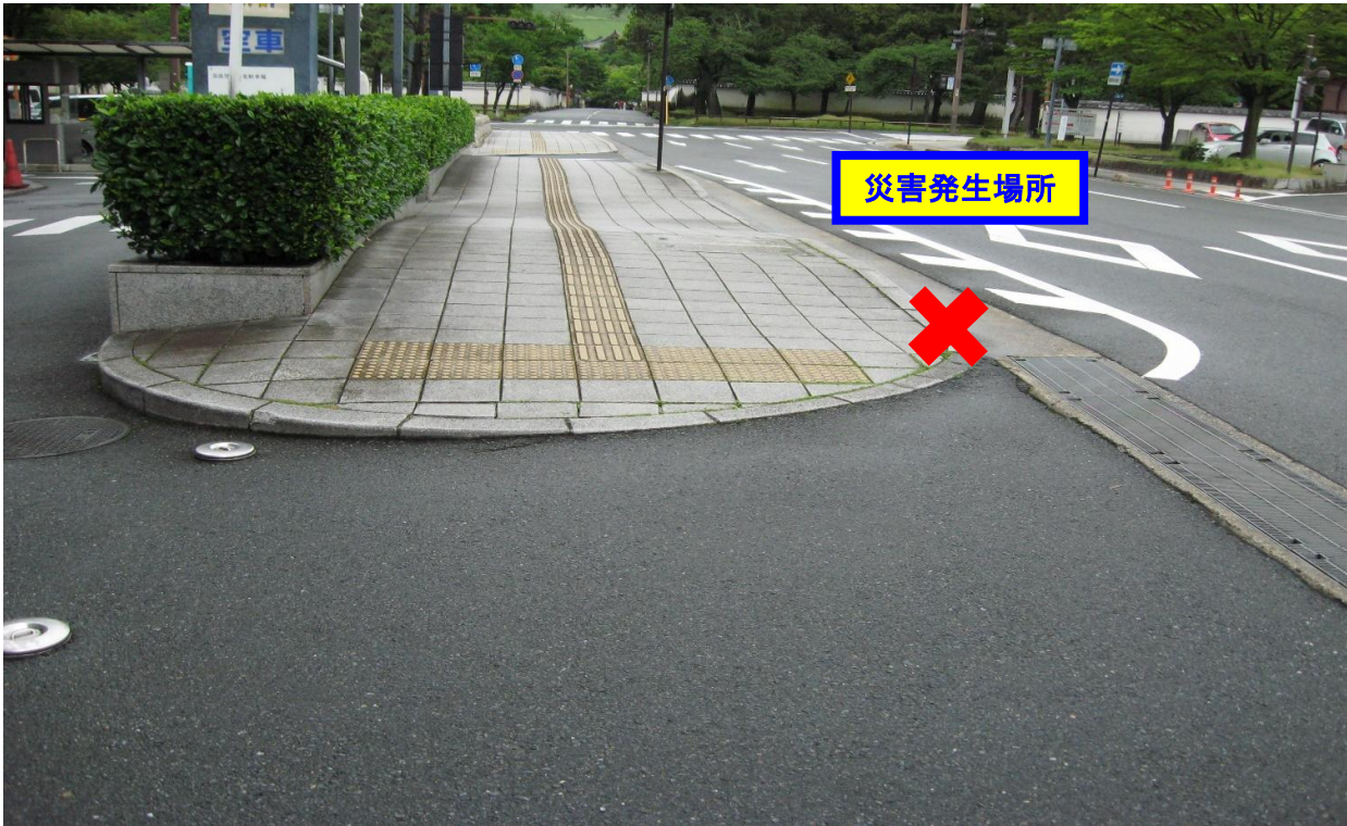
(撮影方向) 西 → 東方向へ撮影