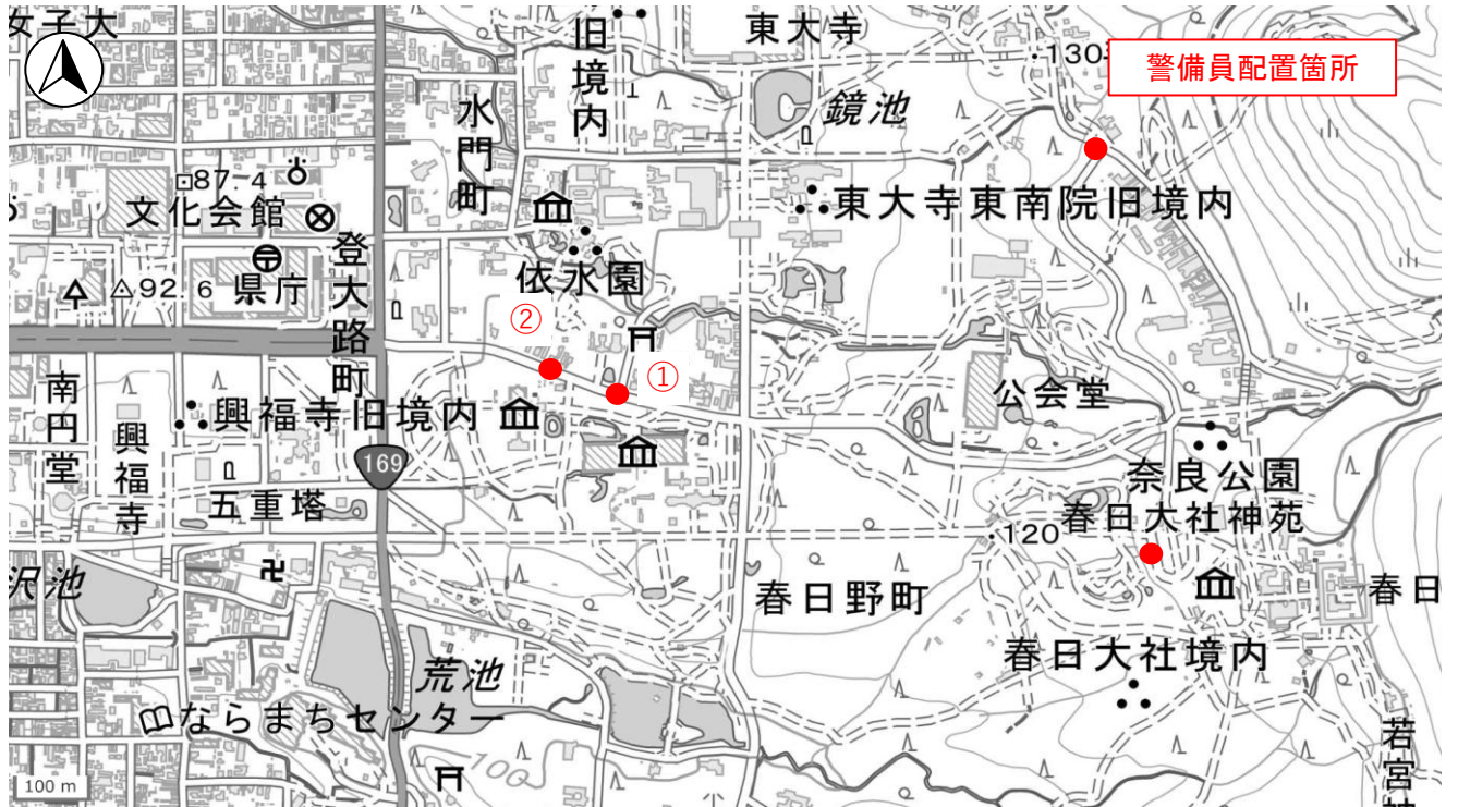
ベース図：国土地理院地図