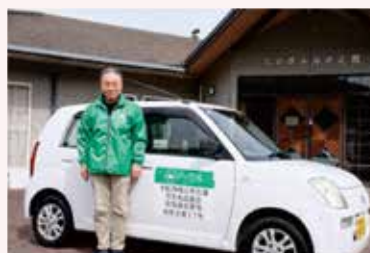
▲マイカーおくだ実証運行（宇陀市内牧地域）

令和6年度より宇陀市内で地域の自治会やまちづくり協議会と連携して実証運行を行っており、7年度の3月より隣接する曽爾村でも実証運行を開始しました。また、8年度には市町村界を跨いだ広域的な運行を行う予定です。