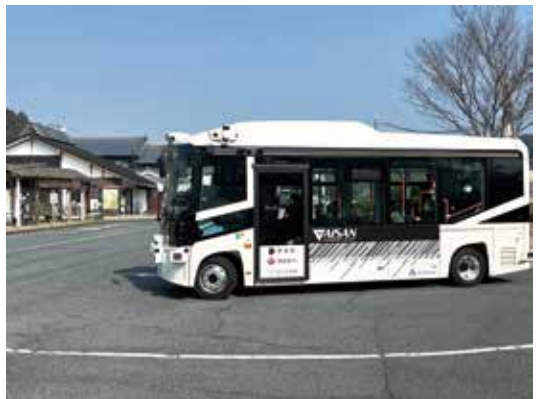
▲自動運転車両の実証運行（明日香村）