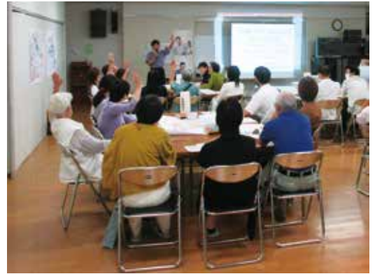
▲地域公共交通に関する住民ワークショップ（五條市）