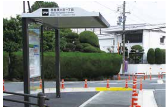
▲バス停の整備（西登美ヶ丘一丁目）