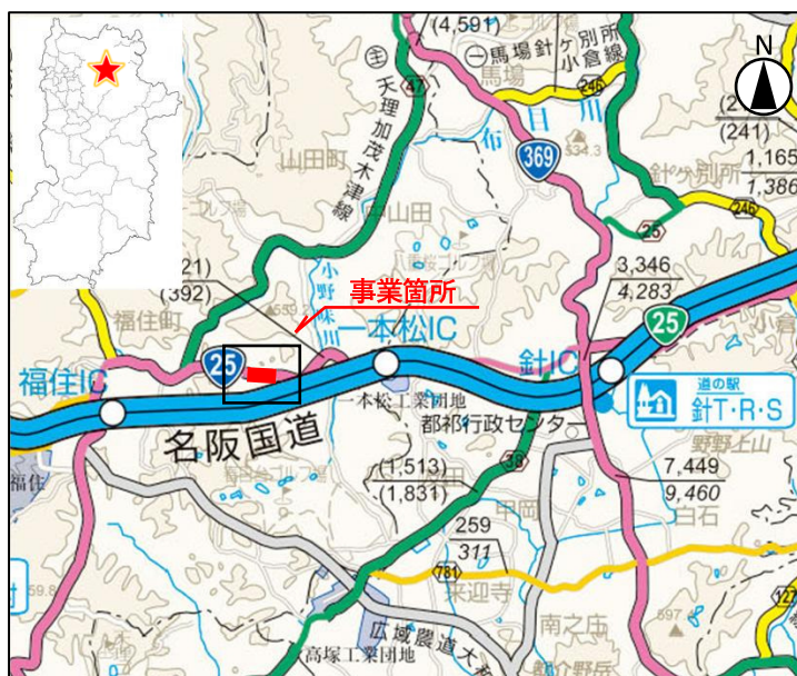
「奈良県道路網図(R6JHs599)を転載」