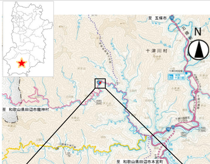
「奈良県道路網図 (R5JHs 506) を転載」