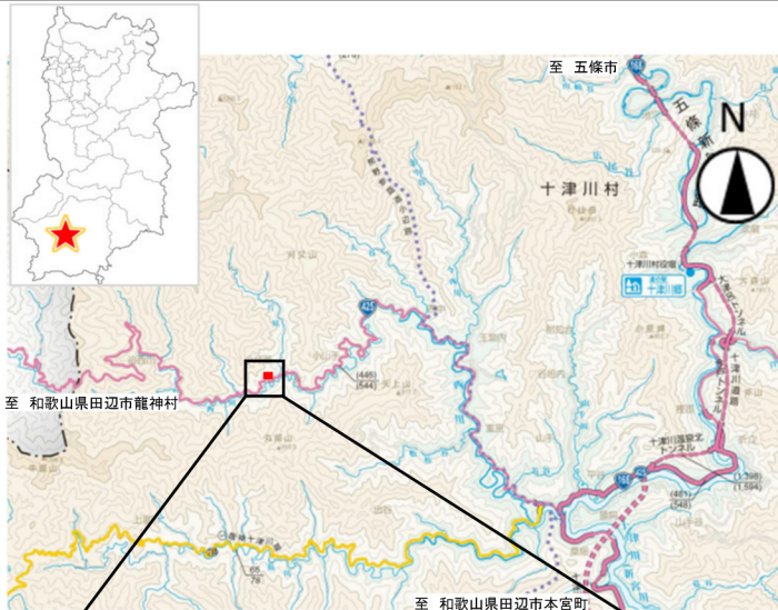
「奈良県道路網図 (R5JHs 506) を転載」