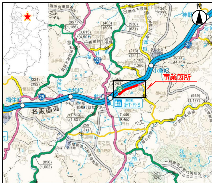
「奈良県道路網図(R6JHs599)を転載」