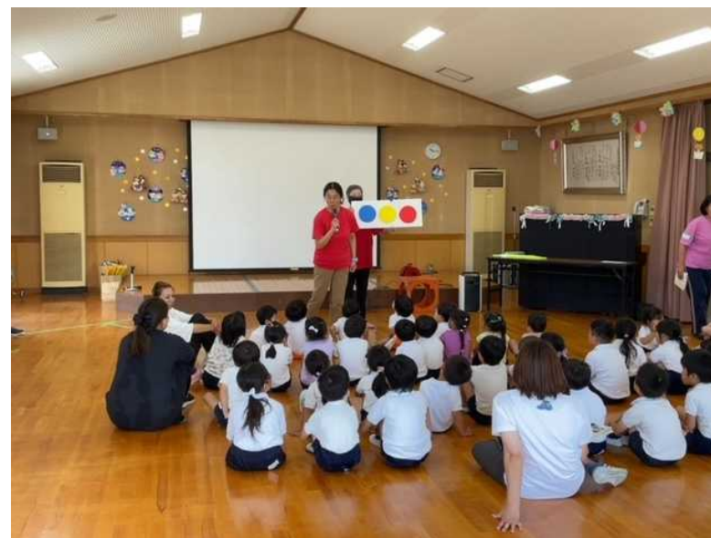
▲児童・幼児向け通学通園路等安全教室の様子