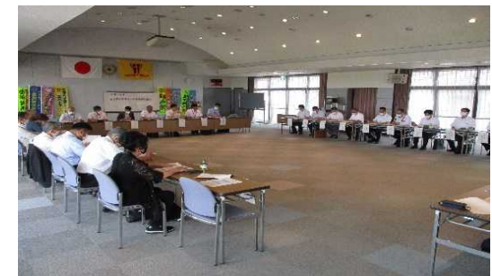
奈良県自転車総合対策連絡協議会の開催▶