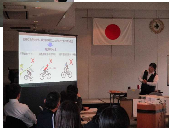
▲交通安全教育担当者講習会