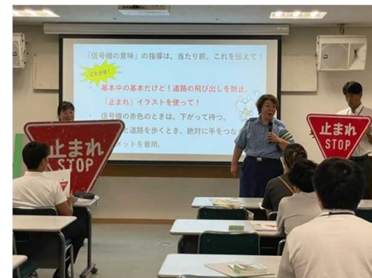
▲市町村職員に対する交通安全講習