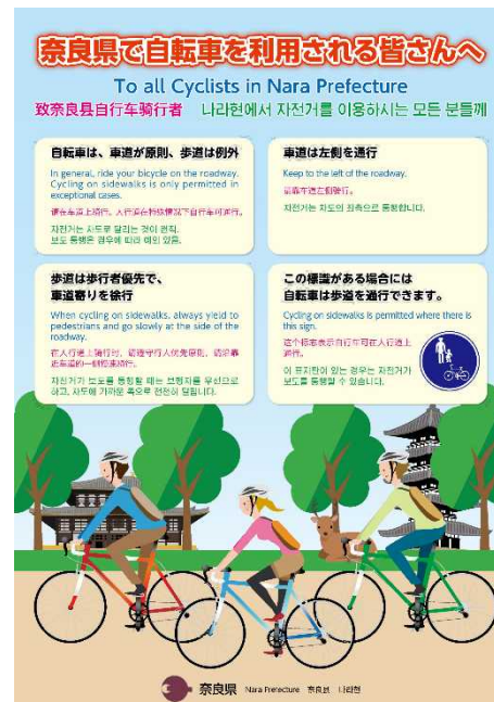
▲多言語対応の自転車交通安全リーフレット