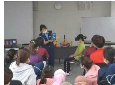
▲高齢者向け安全教室