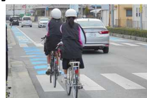
▲普通自転車専用通行帯(広陵町内)