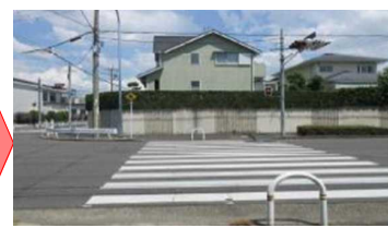
▲自転車横断帯を撤去