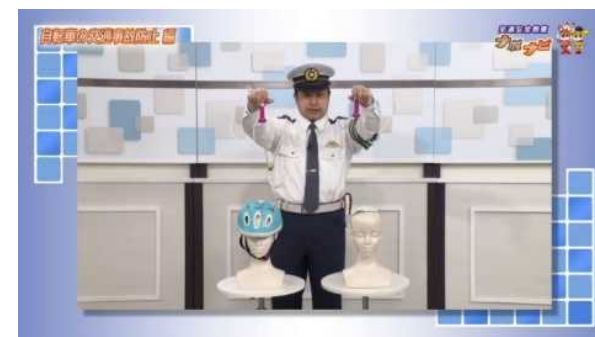
▲自転車の通行ルールやヘルメット着用を周知するYouTube動画