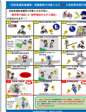
▲自転車運転者講習の対象となる危険行為