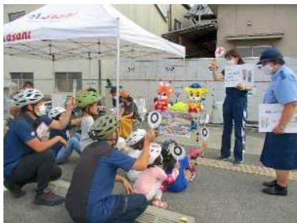
▲子供と保護者に対する交通教室