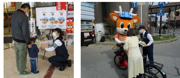
▲交通安全普及啓発活動

担当課: 県民暮らし課、体育健康課、道路マネジメント課 連携先: 県警交通企画課、自転車販売業者、市町村