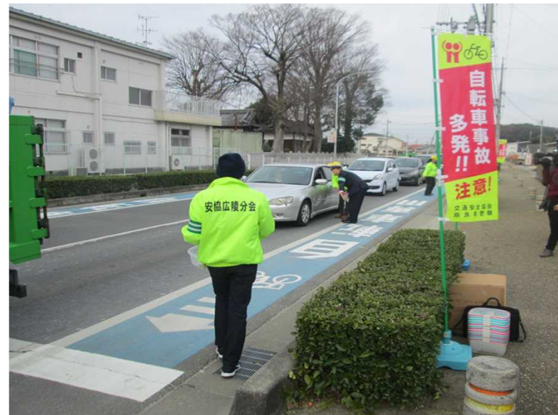
▲関係機関と協力した安全啓発活動