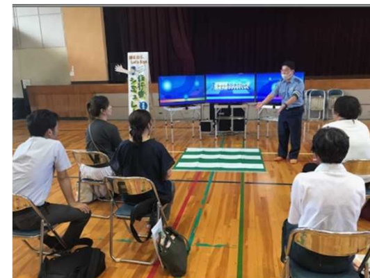
▲教職員向けの交通安全教室