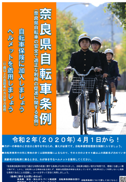
▲自転車の安全で適正な利用の促進に関する条例のポスター